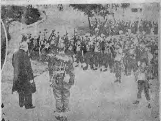
Churchill, el dinámico primer ministro inglés, gusta de las inspecciones porque así se pone en comunicación con los que luchan por la Gran Bretaña. Durante su visita a la zona sur fué ovacionado por las tropas acattonadas en determinado lugar.

TOKIO, 14. UP. — Renunció el Ministro de Marina Almirante Yoshida quien se halla enfermo y ha tenido que ser internado en un hospital.