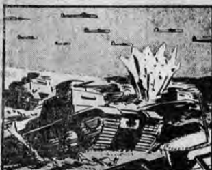
CON SUS FUERZAS MECANIZADAS Y UNA EJERCIÓN FLOTA AEREA, LOS ALEMANES DOMINARON LOS PAISES BAJOS E INVADIERON FLANDES.