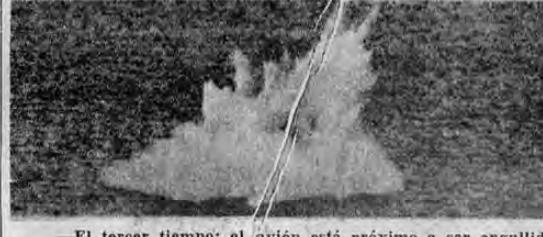
—El tercer tiempo; el avión está próximo a ser engullido por las aguas.