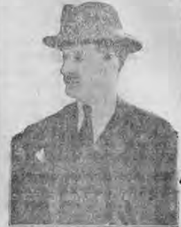
MAYOR ANTONIO EDEN, que piensa que el peligro para Inglaterra no ha pasado todavía.

Ha despertado mucho interés el trato que han llevado a cabo los gobiernos de Londres y de Washington. Los Estados Unidos han entregado o van a entregar en estos días cincuenta destructores de su marina de guerra a la flota británica. Estos destructores han sido calificados como "anticuados" y esta calificación sirve a los escritores de prensa de Italia y de Alemania pa