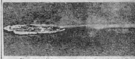
—El cuarto y último momento; el aceite resiste; las llamas se van, no obstante, apagando lentamente. Y luego, la inmersión.