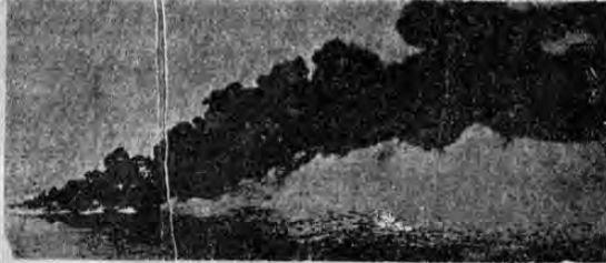
—La caída produce inmediatamente un tremendo incendio; el petróleo se "disuelve" en esta espesa masa de humo.