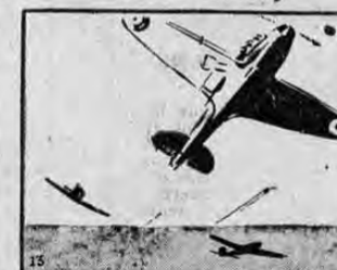
DE PRONTO SUCEDIÓ ALGO QUE NO HABIA PREVISTO EL GENERAL GÖRING: COMENZÓ A HACERSE EVIDENTE QUE LA SUPRIORIDAD NUMÉRICA NO ERA LO ÚNICO...