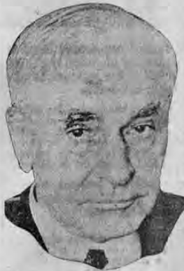
El Secretario de Estado HULL, que negoció con el Embajador inglés Lothian el convenio de las bases y los destructores.