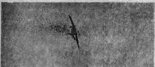
El aparato alemán, tocado por otro británico de persecución, inicia el descenso; la acción transcurre en el Canal de la Mancha