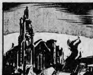
AL PASAR DEJARON EN RUINAS HUMEANTES A CIUDADES DE RENOMBRE MUNDIAL TALES COMO ROTTERDAM, LOVAINA, ARRAS Y GALS.