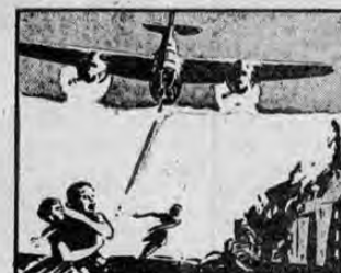
LOS AVIONES DE BOMBARDEO EN FIJADA SEMBRABAN EL PANICO Y LA CONFUSION AMETRALANDO A LOS REFUGIADOS QUE MUFAN POR LAS CARRETERAS.