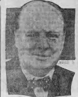
WINSTON CHURCHILL, primer ministro de Su Majestad Británica que ha realizado el acuerdo con los Estados Unidos.

ra hacer una diversidad de conjeturas acerca de la utilidad de los dichos barcos. En cambio de los 50 destructores Inglaterra ha cedido a los Estados Unidos nueve zonas, a lo largo del continente y en posiciones que hasta ahora fueron inglesas, para que los norteamericanos puedan utilizarlas en la defensa de continente en caso de que este fuese atacado en algún tiempo dentro de 20 años a contar desde ahora. Para los americanos ese